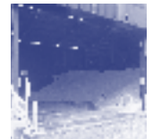
Limburg pakt uit: Open Huis 4