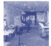
Publieksgericht in Viascoop 7