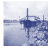
Samen meten in Eijsden 2